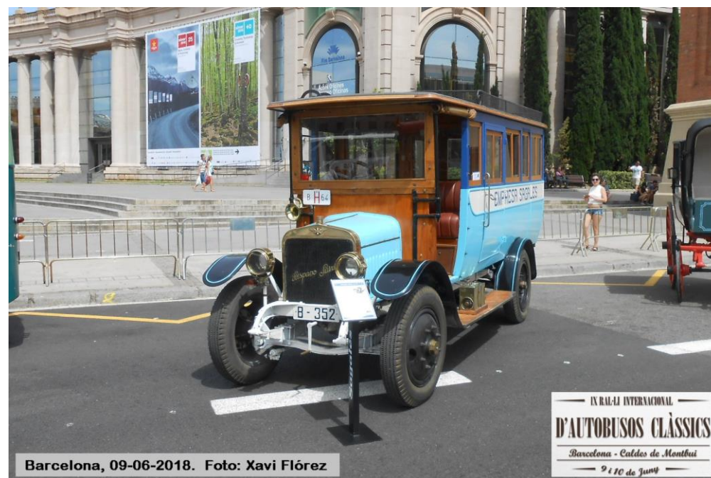
Barcelona, 09-06-2018.