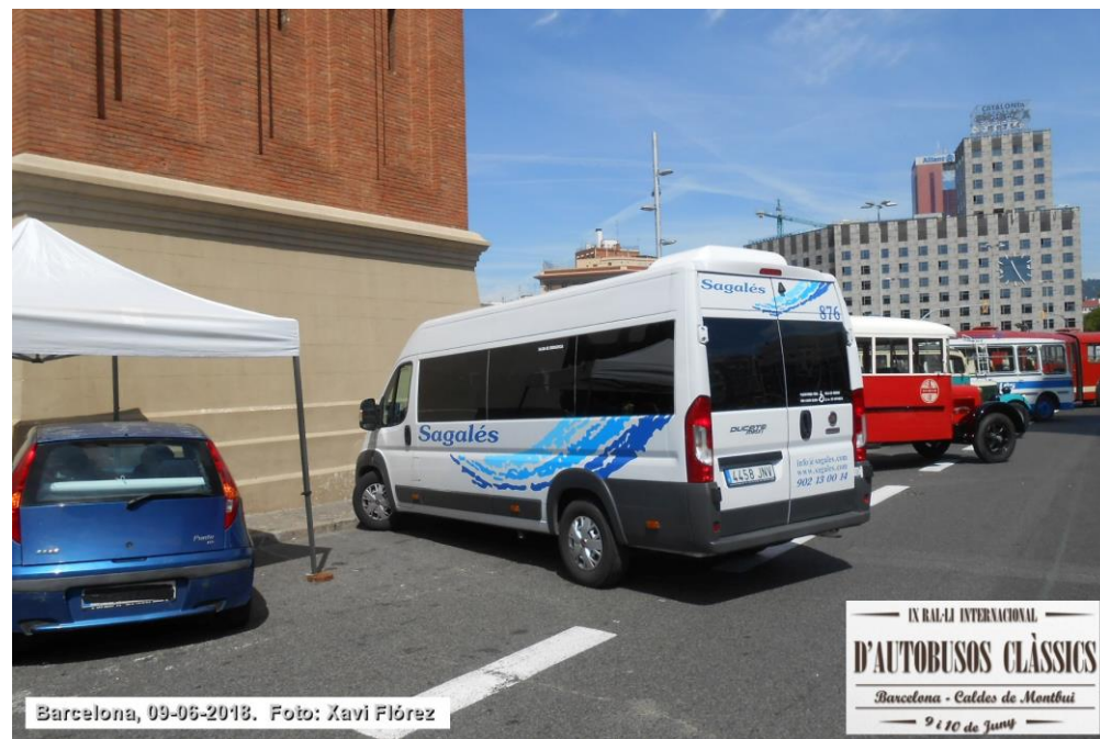
IX RAJ-IJ INTERNACIONAL D'AUTOBUSOS CLÀSSICS Barcelona - Caldes de Montbui 9 i 10 de Juny