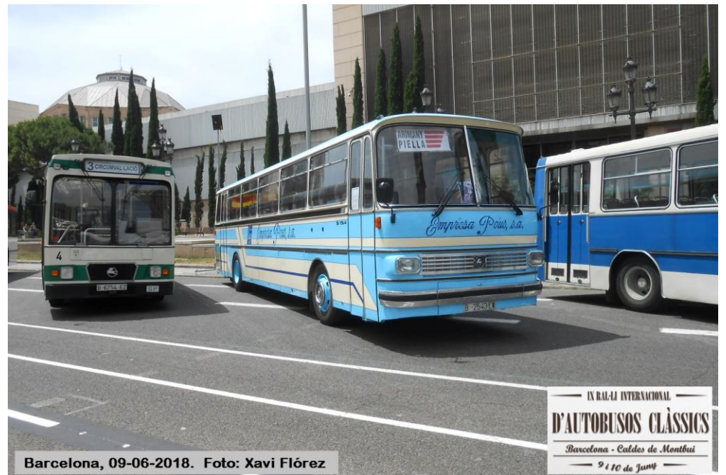
Barcelona, 09-06-2018.

IX RAL-LI INTERNACIONAL D'AUTOBUSOS CLÀSSICS Barcelona - Caldes de Montbui 9 i 10 de Juny