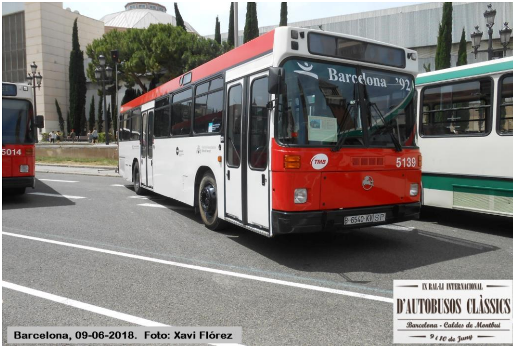
Barcelona, 09-06-2018.