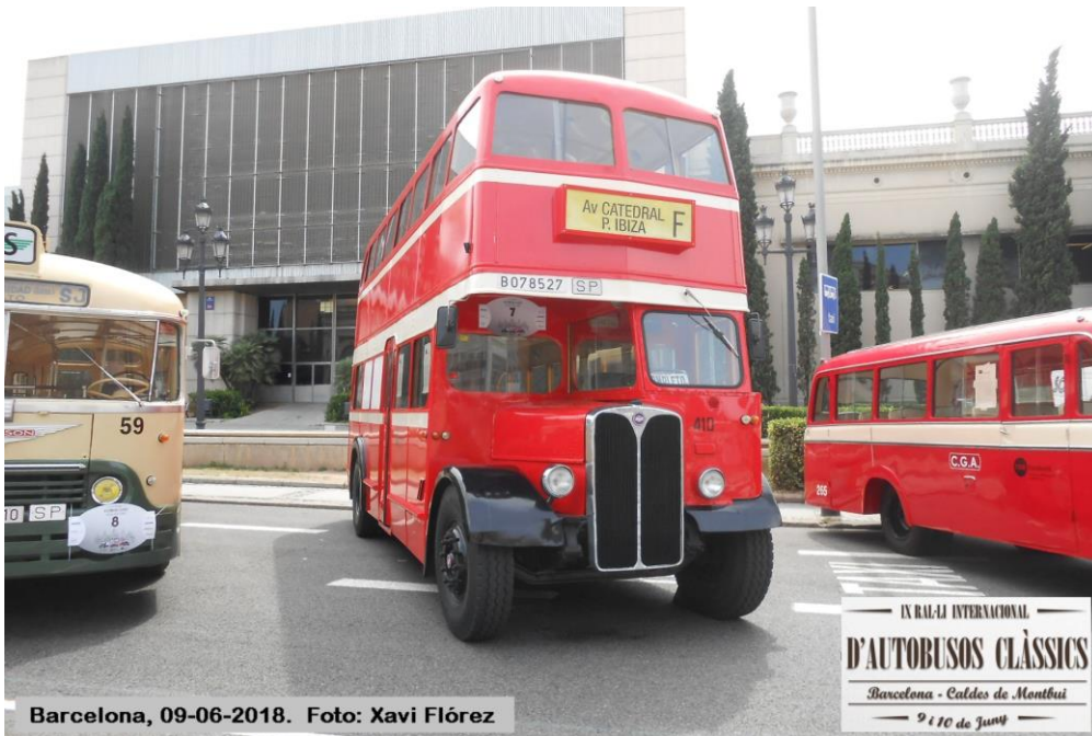
Barcelona, 09-06-2018.