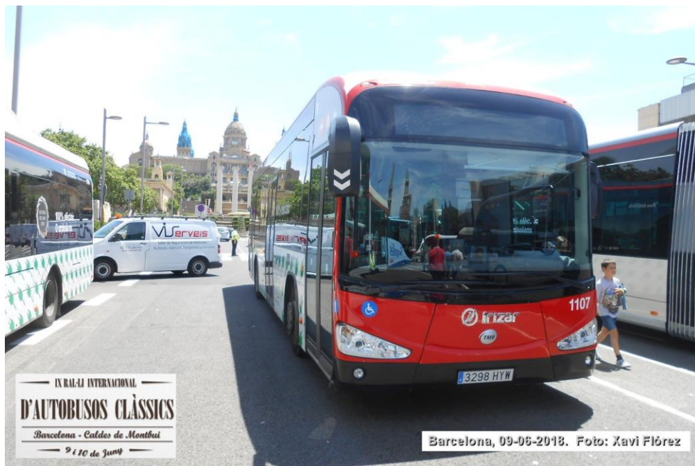
IX RAJ-IJ INTERNACIONAL D'AUTOBUSOS CLÀSSICS Barcelona - Caldes de Montbui 9 i 10 de Juny