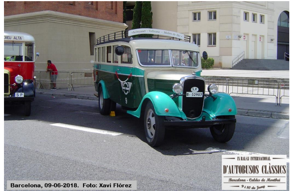
Barcelona, 09-06-2018.