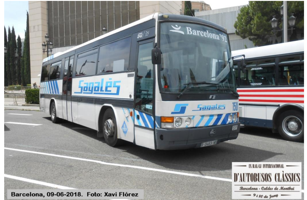
Barcelona, 09-06-2018.