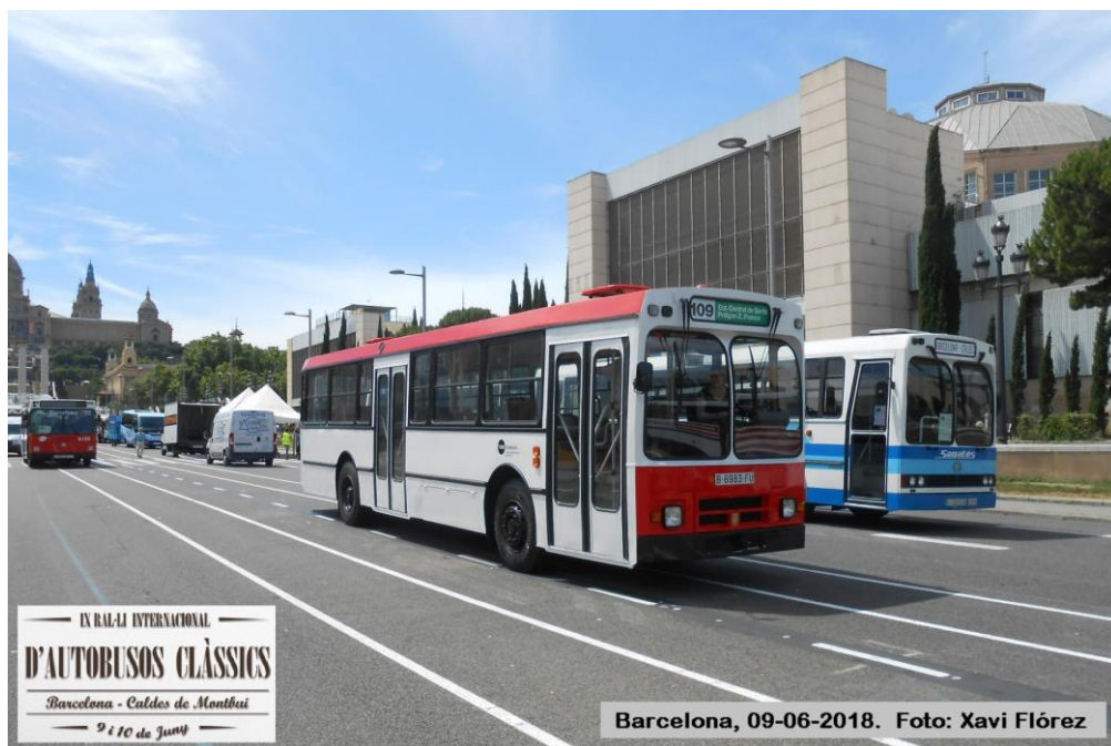
Barcelona, 09-06-2018.