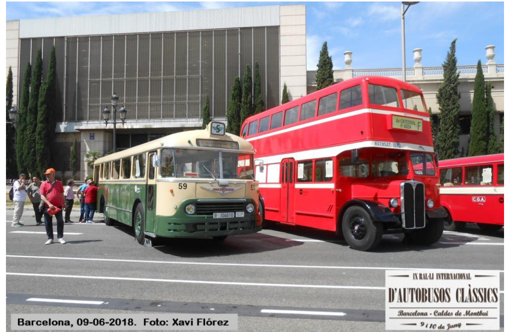
Barcelona, 09-06-2018.