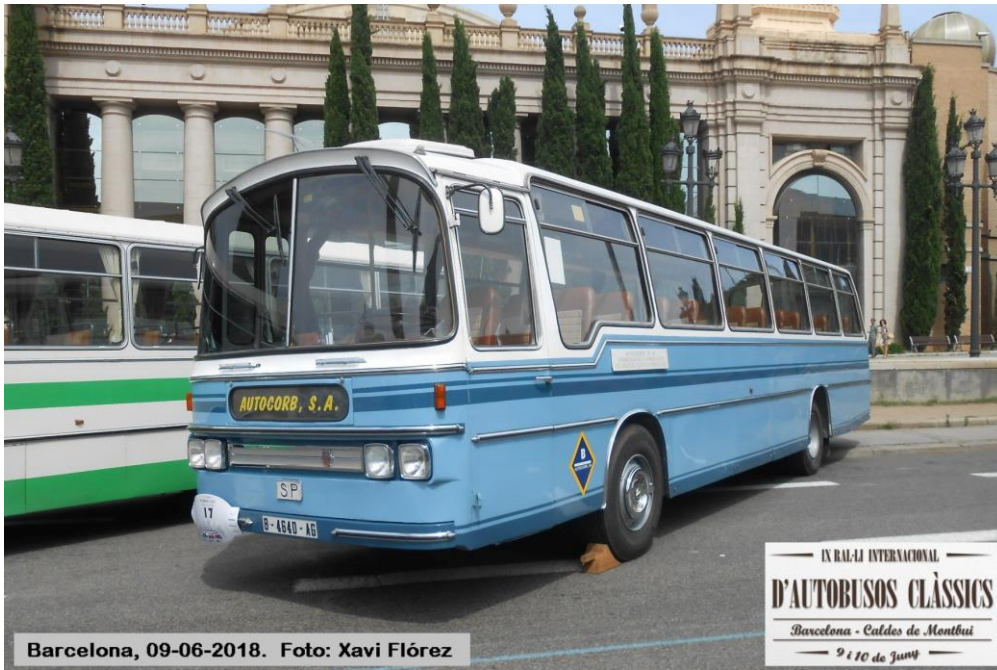
Barcelona, 09-06-2018.