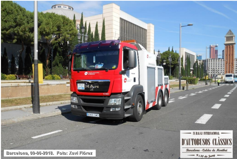
Barcelona, 09-06-2018.

IN RAL-11 INTERNACIONAL D'AUTOBUSOS CLÀSSICS Barcelona - Caldes de Montbui 9 i 10 de Juny