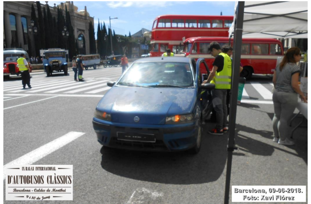
IX RAL·LI INTERNACIONAL D'AUTOBUSOS CLÀSSICS Barcelona - Caldes de Montbui 9 i 10 de Juny