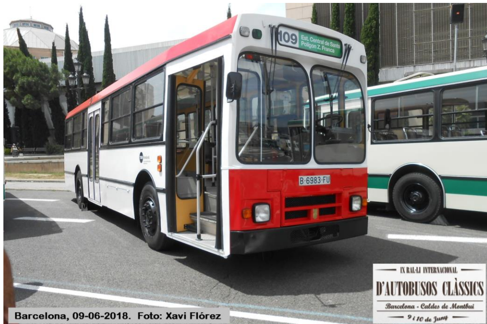
Barcelona, 09-06-2018.