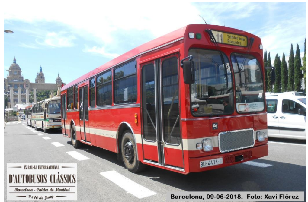
Barcelona, 09-06-2018.