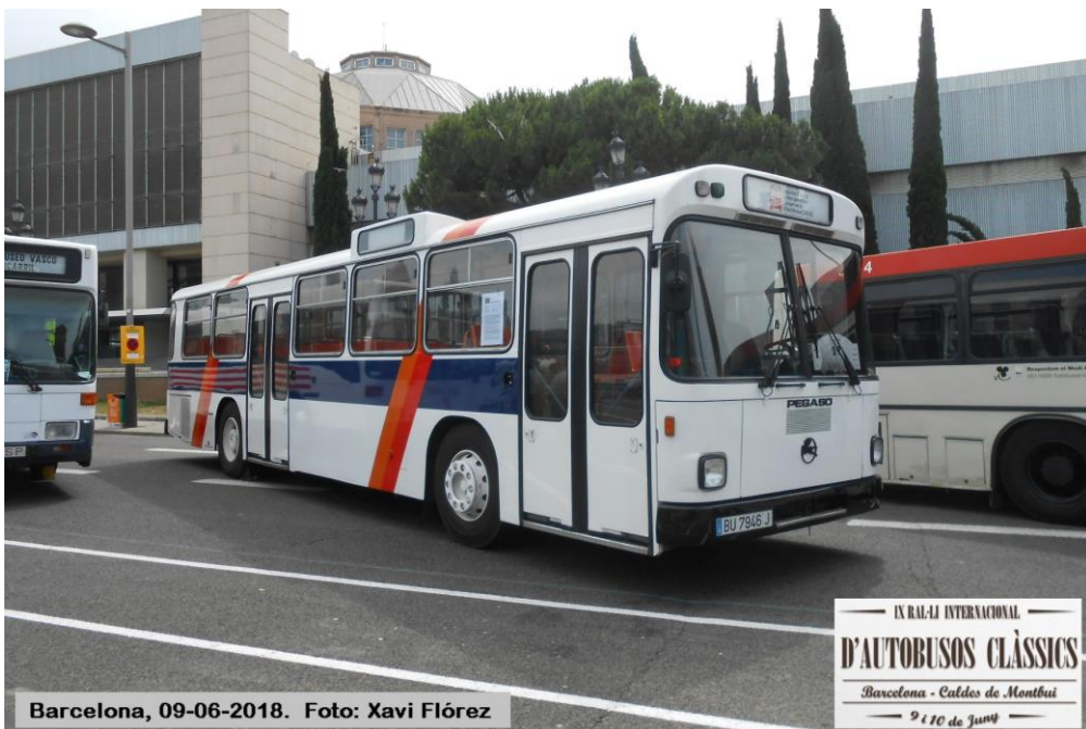
Barcelona, 09-06-2018.