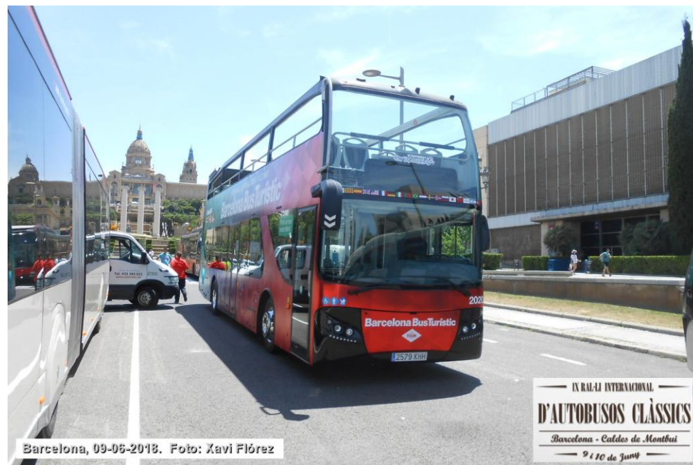
IX RAJ-IJ INTERNACIONAL D'AUTOBUSOS CLÀSSICS Barcelona - Caldes de Montbui 9 i 10 de Juny