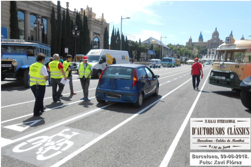
IX RAL·LI INTERNACIONAL D'AUTOBUSOS CLÀSSICS Barcelona - Caldes de Montbui 9 i 10 de Juny