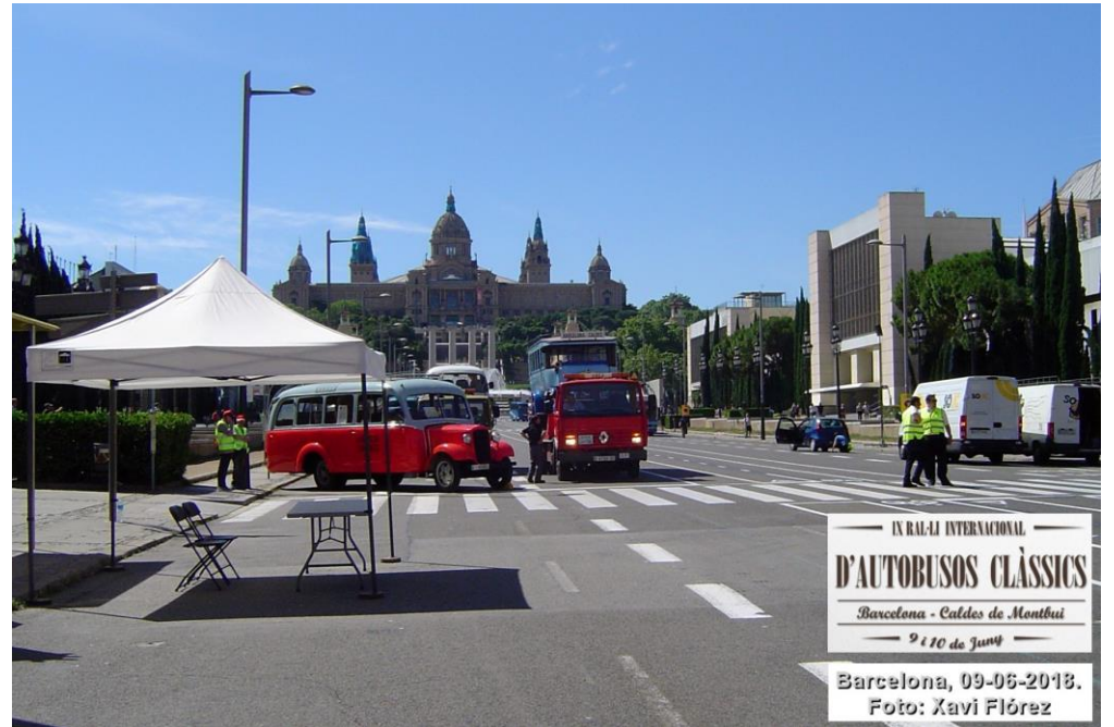
IX RAL·LI INTERNACIONAL D'AUTOBUSOS CLÀSSICS Barcelona - Caldes de Montbui 9 i 10 de Juny