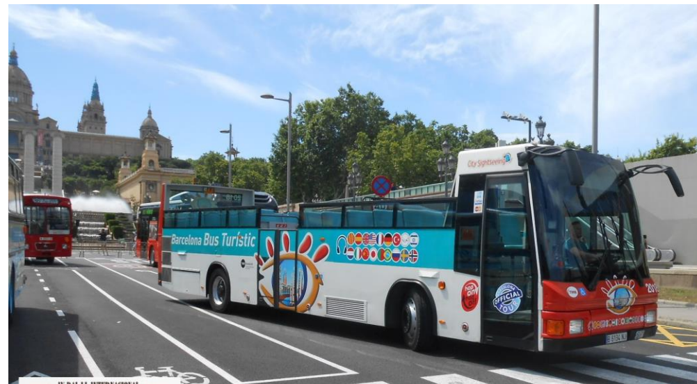
Barcelona, 09-06-2018.

IX RAL·LI INTERNACIONAL D'AUTOBUSOS CLÀSSICS Barcelona - Caldes de Montbui 9 i 10 de Juny