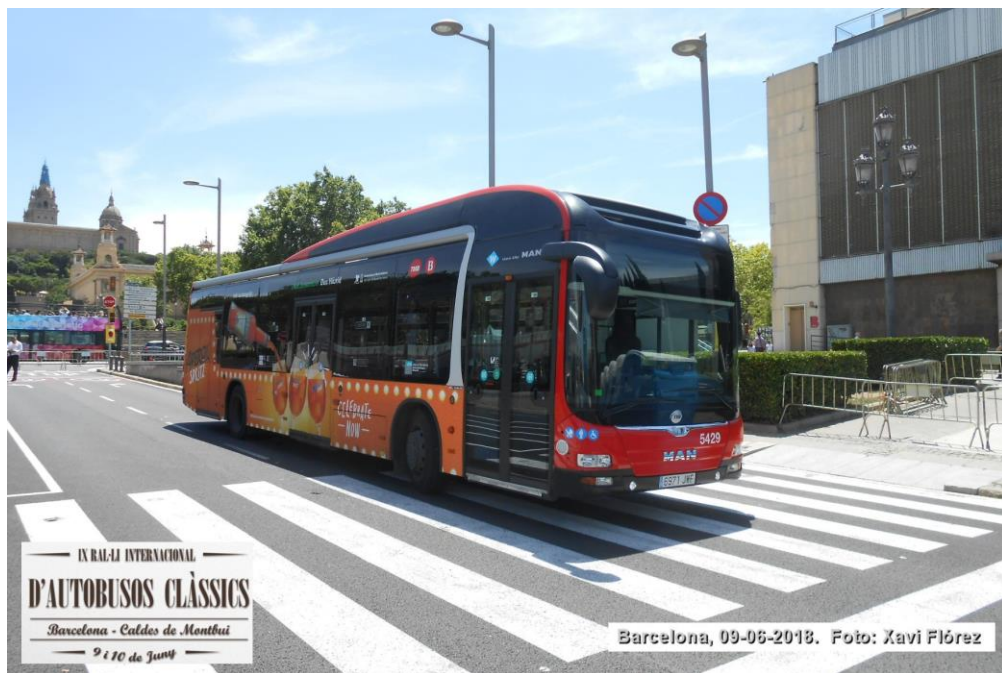
IX RAJ-IJ INTERNACIONAL D'AUTOBUSOS CLÀSSICS Barcelona - Caldes de Montbui 9 i 10 de Juny