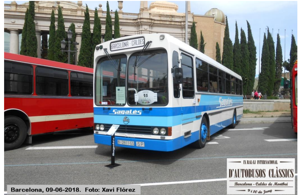
Barcelona, 09-06-2018.