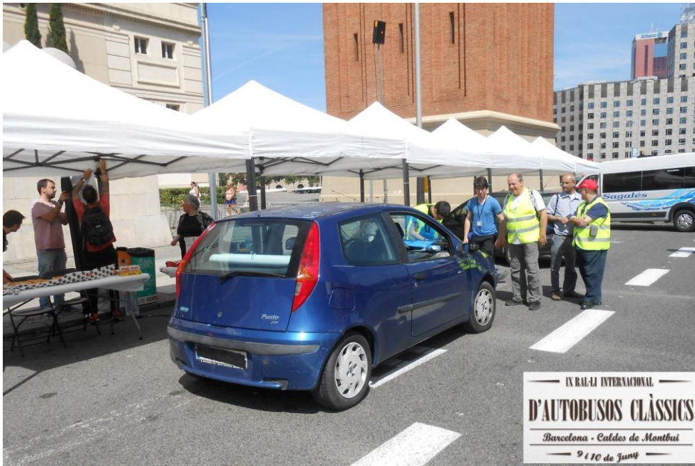
IX RAL·LI INTERNACIONAL D'AUTOBUSOS CLÀSSICS Barcelona - Caldes de Montbui 9 i 10 de Juny