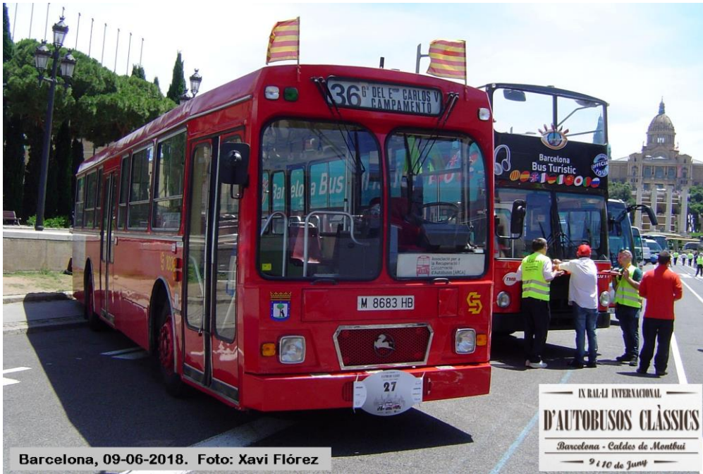
Barcelona, 09-06-2018.