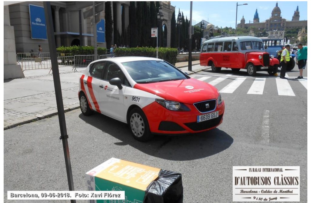
Barcelona, 09-06-2018.

IN RAL-11 INTERNACIONAL D'AUTOBUSOS CLÀSSICS Barcelona - Caldes de Montbui 9 i 10 de Juny