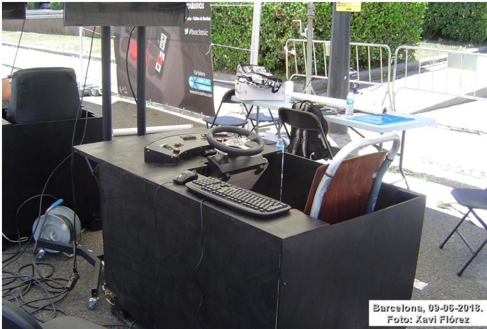
Barcelona, 09-06-2018.