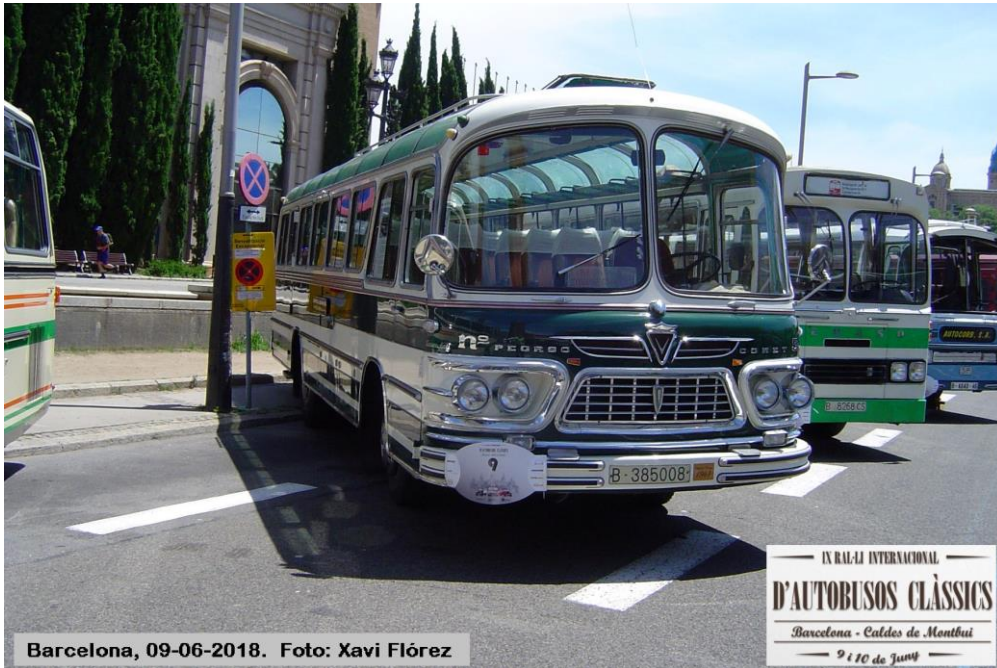
Barcelona, 09-06-2018.