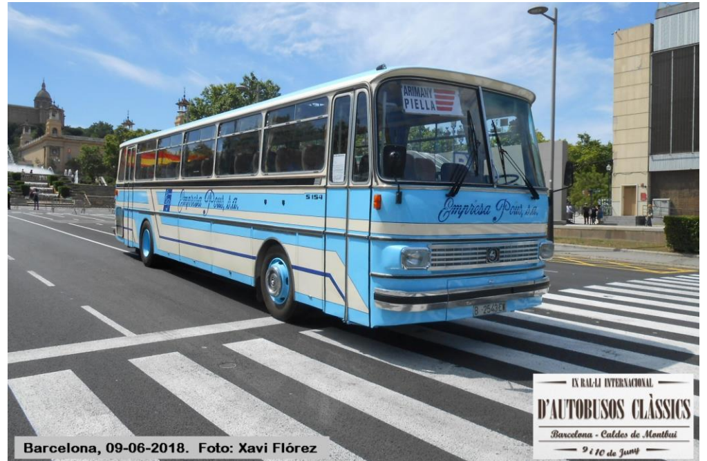
Barcelona, 09-06-2018.

IX RAL-LI INTERNACIONAL D'AUTOBUSOS CLÀSSICS Barcelona - Caldes de Montbui 9 i 10 de Juny